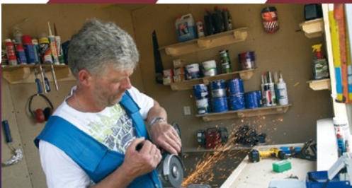
Garage, kelder of hobbyruimte