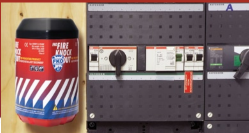
Meterkast of ketelruimte